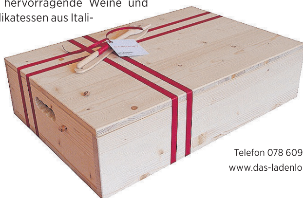
Telefon 078 609 51 70 www.das-ladenlokal.ch

en und handgeschaffene Unikate, erfreuen das Auge und den Gaumen des Beschenkten. Produkte und Verpackung entstammen einer schonenden Produktion und fairem Handel und zeigen auf, wie sich verantwortungsvoller Konsum, Genuss und Nachhaltigkeit im Alltag verbinden lassen. Die Schatzkiste ist online in zwei Grössen erhältlich mit Inhalten im Wert von 60 bis 200 Franken.